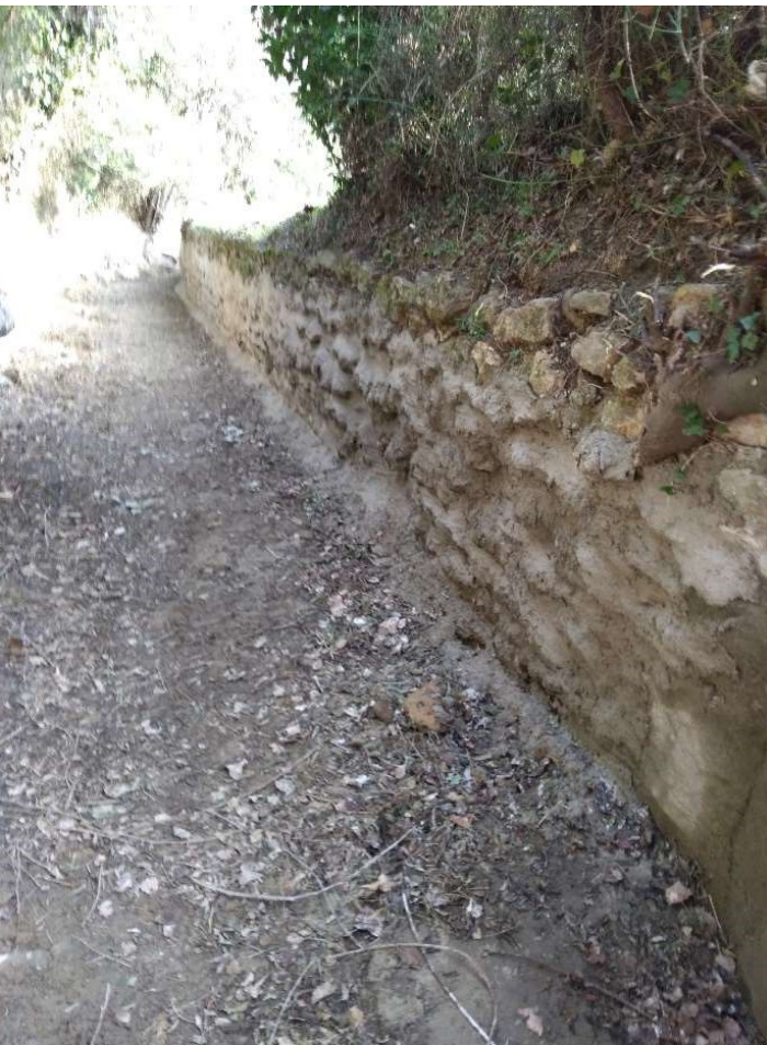
Maçonnerie Canal Commun