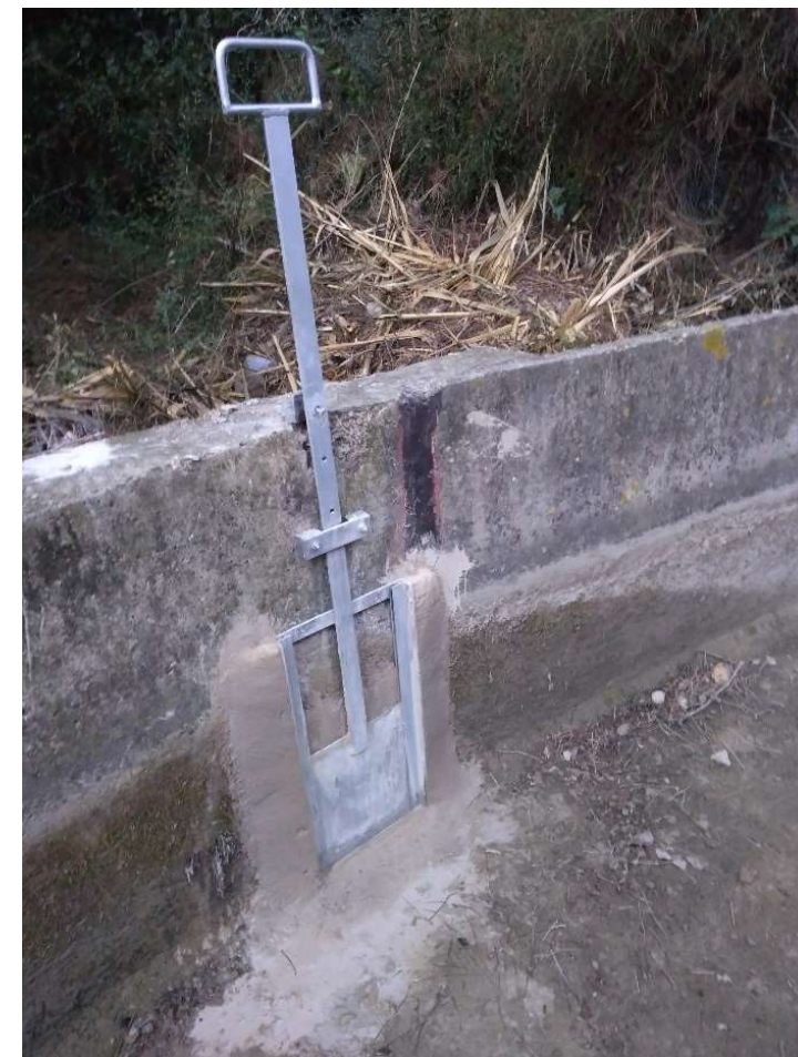
Changement de Martelière