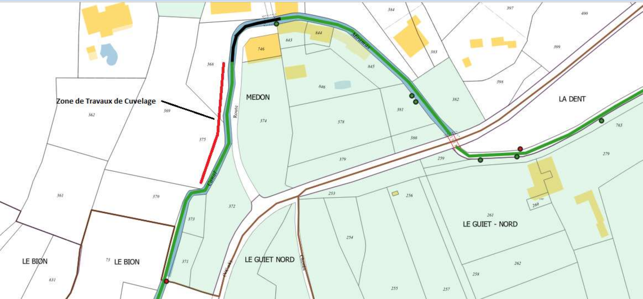
Cuvelage Chemin des Combe